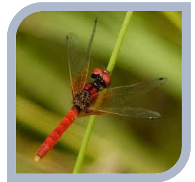
ハッチョウトンボ 雄

大人のオスはきれいな赤とんぼです。 ほかのトンボや昆虫、トノサマガエルなど色々な初夏の里山の生物や めずらしい湿原植物を目の前で見るができます。