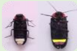
ホテル（左オス右メス）