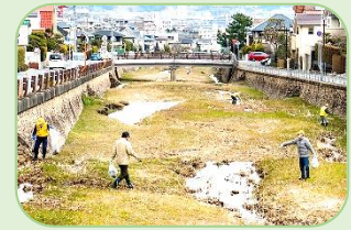
逆瀬川の美化活動