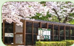
ホテルの里 ピカピカランド