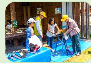
こむ1のこぎり大会

宝塚市、環境都市宝塚推進市民会議の一員として「宝塚環境フォーラムの環境パネル展」への出展やこむ1フェスティバルで「のこぎり大会」を開催しました。創立20周年記念行事として、岡山県自然保護センターを訪問し交流会を行いました。