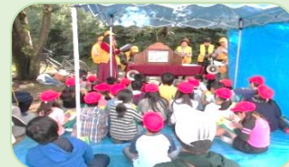
紙芝居によるホテルの説明