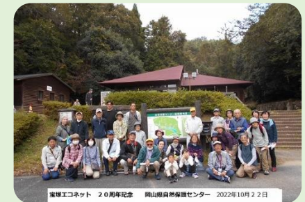
岡山県自然保護センター訪問