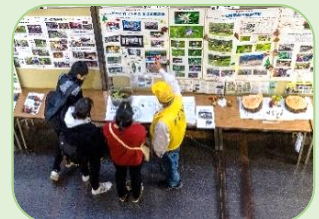
環境フォーラムパネル展