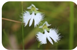
サギソウ(湿原) ラン科多年草 RDB:B