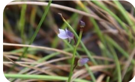
ムラサキミミカキグサ(湿原) タヌキモ科多年草 RDB:C