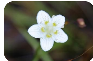
ウメバチソウ(湿原) ユキノシタ科多年草