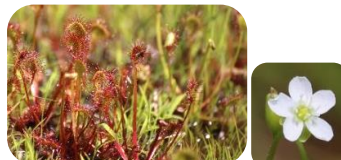
モウセンゴケ(湿原) モウセンゴケ科食虫植物