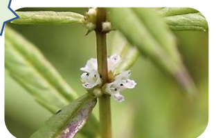
ヒメシロネ(湿原) シソ科多年草