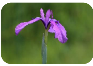
ノハナショウブ(湿原) アヤメ科多年草 RDB:C