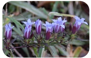
リンドウ(非湿原) リンドウ科多年草