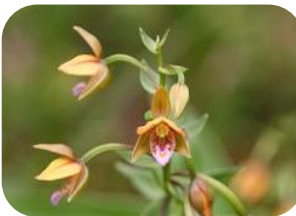
カキラン(湿原) RDB:C ラン科多年草