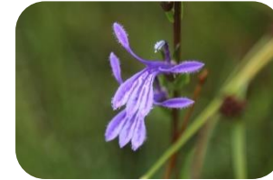
サワギキョウ(湿原) キキョウ科多年草