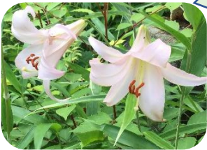
ササユリ(非湿原) ユリ科多年草