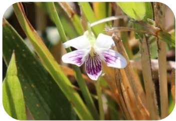
ヒメアギスマレ(湿原) スマレ科多年草