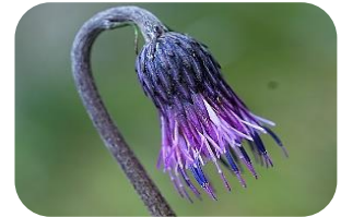
キセルアザミ(湿原) キク科多年草