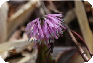
ショウジョウバカマ(非湿原) シュロソウ科多年草