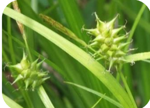
オニスゲ(湿原) カツリグサ科多年草