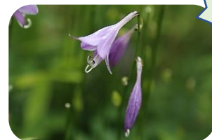
ミズキボウシ(湿原) ギク科多年草 近 RDB:C