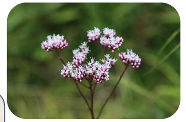
サワヒヨドリ(湿原) キク科多年草