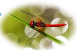
ハッチョウトンボ(湿原) トンボ科 RDB:B