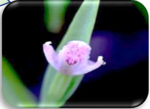
ヤマトキソウ(非湿原) ラン科多年草 RDB:C