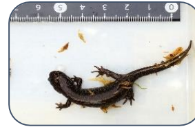
セトウチサンショウウオ サンショウウオ科 RDB:B