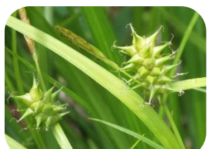
オニスゲ(湿原) カツリガサ科多年草