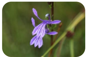
サワギキョウ(湿原) キキョウ科多年草