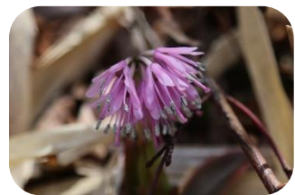
ショウジョウハカマ(非湿原) シュロソウ科多年草