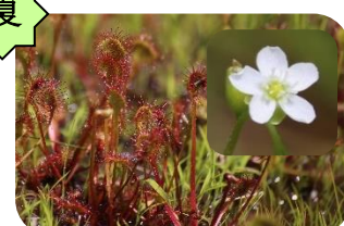
モウセンゴケ(湿原) トウモロコシ科多年草 食虫植物