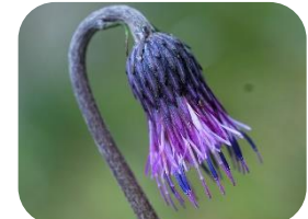
キセルアザミ(湿原) キク科多年草