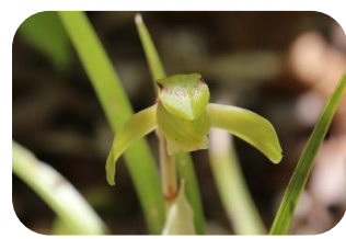
シュンラン(非湿原) ラン科多年草