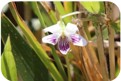
ヒメアギスミレ(湿原) スミレ科多年草