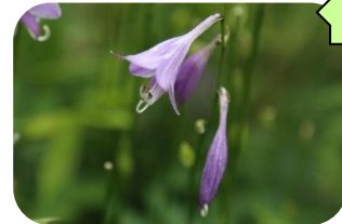
ミズギボウシ(湿原) ユリ科多年草 近RDB:C