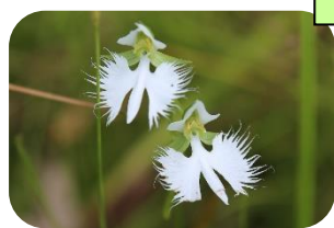
サギソウ(湿原) ラン科多年草 RDB:B