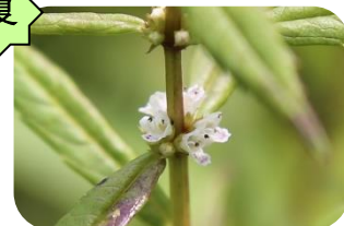
ヒメシロネ(湿原) シソ科多年草