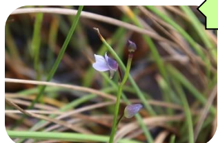
ムラサキミカキグサ(湿原) RDB:C タヌキモ科多年草 食虫植物