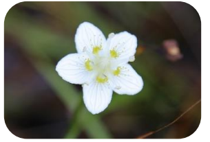
ウメバチソウ(湿原) ユキノシタ科多年草