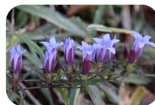
リンドウ(非湿原) リンドウ科多年草