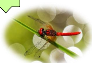
ハチョウトンボ♂(湿原) トンボ目 RDB:B