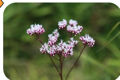
サワヒヨドリ(湿原) キク科多年草