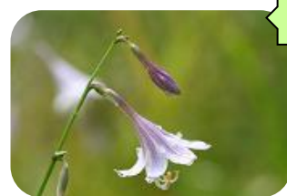
ミズギボウシ(湿原) ユリ科多年草 近RDB:C