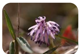
ショウゴヨハカ(非湿原) ユリ科多年草