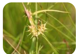
オニスゲ(湿原) カツリガサ科多年草