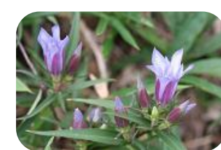
リンドウ(非湿原) リンドウ科多年草