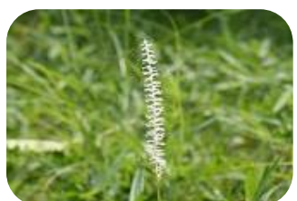
シライトソウ(非湿原) ユリ科多年草