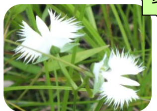
サギソウ(湿原) ラン科多年草 RDB:B