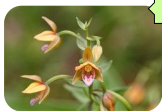
カキラン(湿原) RDB:C ラン科多年草