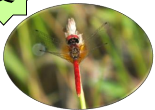
ハチョウトンボ♂(湿原) トンボ目 RDB:B