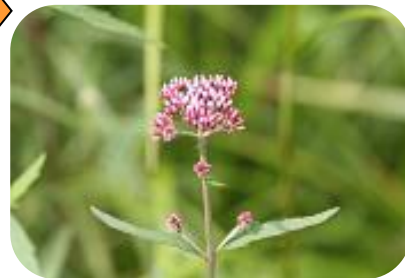
サワヒヨドリ(湿原) キク科多年草