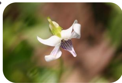
ヒメアギスミレ(湿原) スミレ科多年草