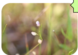
ムラサキミカクサ(湿原) RDB:C タヌキモ科多年草 食虫植物