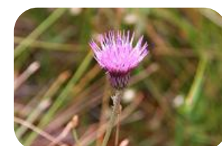
キセルアザミ(湿原) キク科多年草