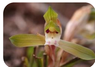
シュンラン(非湿原) ラン科多年草