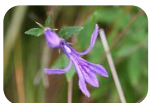
サワギキョウ(湿原) キキョウ科多年草