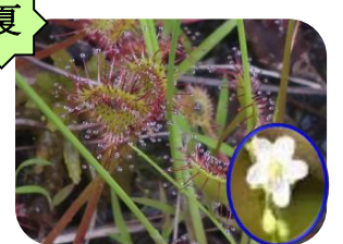
モウセンゴケ(湿原) トウモロコシ科多年草 食虫植物