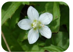
ウメバチソウ(湿原) ユキノシタ科多年草