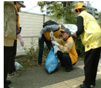
拾ったゴミを分別し計測