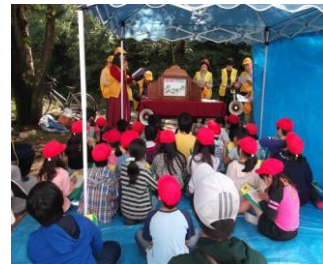
紙芝居によるホタルの説明