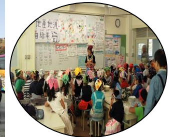
環境学習 エコクッキング