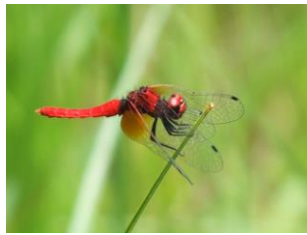
復活したハッチョウトンボ