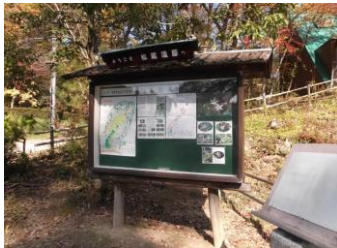
会員手作り湿原の案内看板