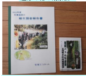
植生調査報告書とポケット図鑑