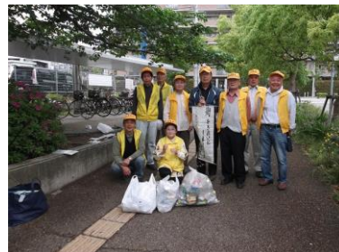
美化活動(ゴミ拾い)

阪急売布駅周辺の道路・公園、逆瀬川等の環境美化活動としてゴミ拾い等を毎月1回を目標に実施しています。