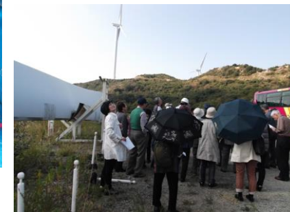
淡路島CEFウインドファーム風力発電見学