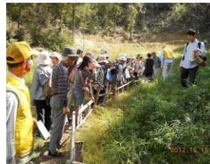
湿原の花の観察会