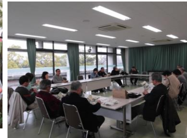
リーダー入門講座(ECO講座)

また、他のボランティアグループと協働で環境学習や市内の小学生を対象にしたエコクッキングなどの環境学習を行っています。